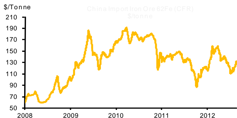
Figure 5: China Import Iron Ore 62Fe (CFR) $/tonne